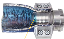
Intégration classique avec coquille de serrage

Afin de garantir un raccordement lisse , hygiénique et sans volume mort entre le tuyau flexible et le robinet , nous avons développé une nouvelle procédure de test : Un liquide coloré en bleu est pompé dans le tuyau flexible avec une pression maximale pendant 7 jours . Puis, l'extrémité du tuyau est retirée afin de vérifier l'étanchéité et la qualité du joint du raccordement . Les résultats sont de première classe et visibles par rapport aux techniques de raccordement traditionnelles.