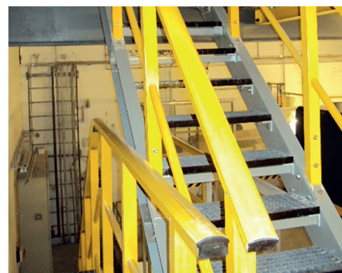
Treppen, Leitern und Geländer

Weitere Informationen erhalten Sie bei Maagtechnic telefonisch unter der Nummer +41 (0)61 315 30 30 oder per E-Mail an kunststoffzentrum-ch@maagtechnic.com